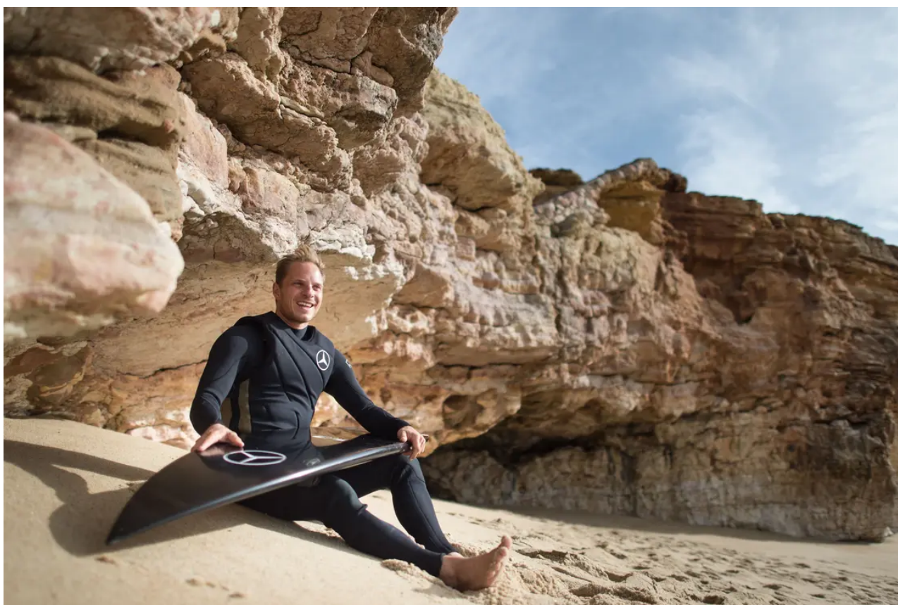
Sebastian Steudtner im Jahr 2015 in Nazaré, am Nabel seiner Welt.