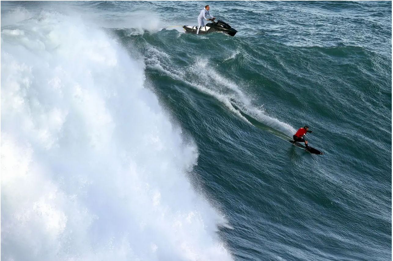
Maya Gabeira surft eine Welle, Sebastian Steudtner fährt den Jetski. Jetzt halten beide den Weltrekord, sie bei den Frauen, er bei den Männern.

Sie sind aufgrund Ihrer Herkunft ein Aussenseiter im Big-Wave-Surfen, die Brasilianerin Gabeira aufgrund ihres Geschlechts. Hat vielleicht auch das etwas Verbindendes?