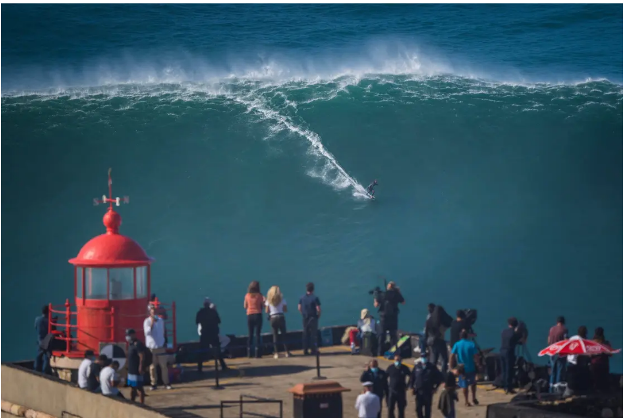
Sebastian Steudtner am Tag seines Weltrekordes im Oktober 2020 an der Praia do Norte in Nazaré.

Ich realisierte auf einmal die extreme Dimension der Welle – und dass ich richtig Gas geben muss. Ich war so schnell, dass mir tatsächlich Tränen aus den Augen schossen vom Fahrtwind. Die Finnen meines Boards summten, ich musste es die ganze Zeit vom Ausbrechen abhalten, konnte es aber fast nicht mehr adjustieren. Ich war wirklich am Limit. So kam ich zur Erkenntnis, dass die Boards besser werden müssen, dass wir neue Technologie brauchen, um noch weiter zu kommen.